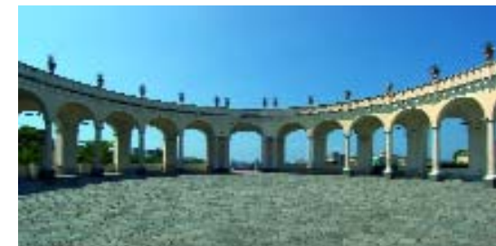
Reggia di Portici