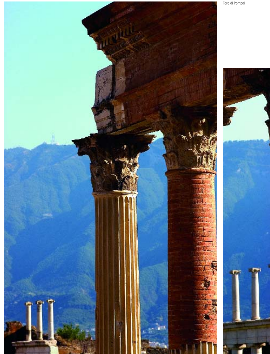
Foro di Pompei