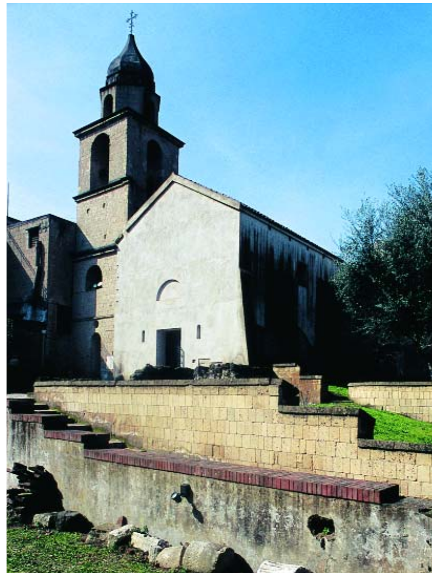
Le Basiliche di Cimitile