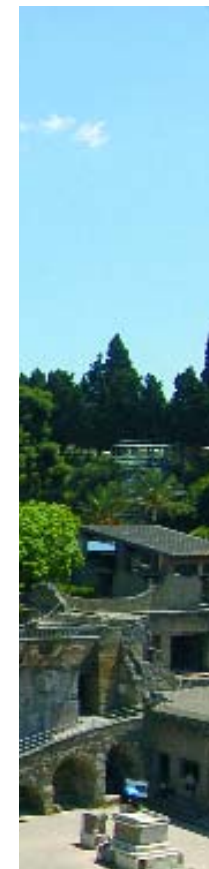
Scavi di Ercolano