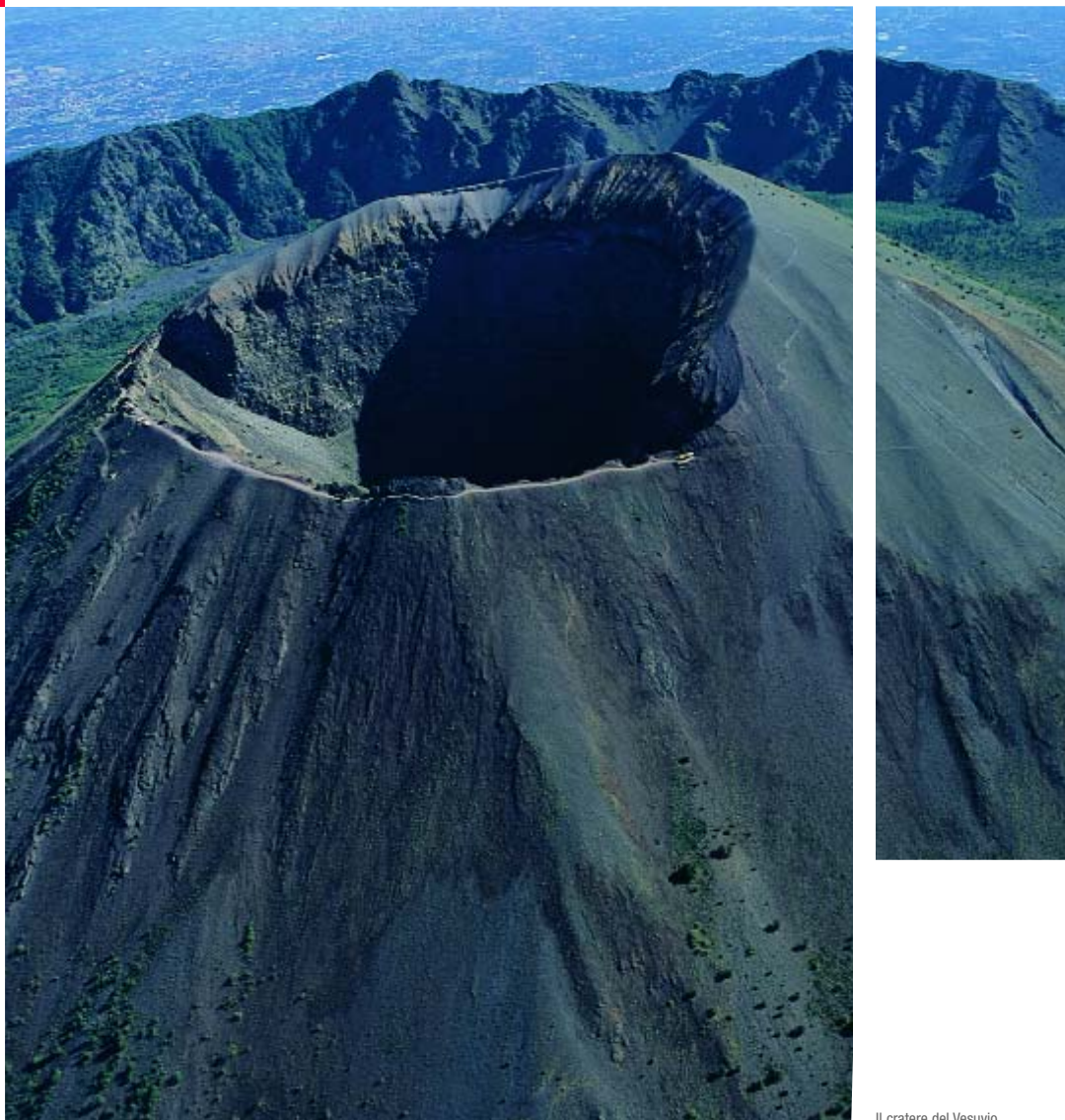
Il cratere del Vesuvio