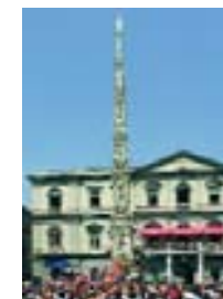
La festa dei Gigli di Nola

ognuna formata da circa 128 persone. La festa ha luogo nella prima domenica dopo il 22 giugno, festa di san Paolino.