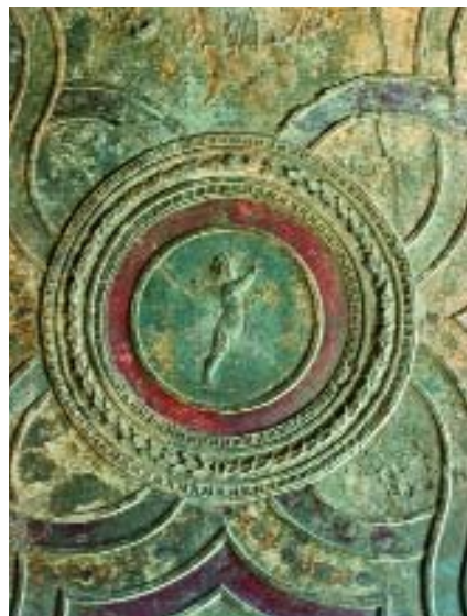
Particolare delle Terme Stabiane

La più importante arteria cittadina era la via dell'Abbondanza (il nome è moderno, come tutti quelli di Pompei), su cui si affacciavano botteghe artigiane, osterie, locande, tintorie. Su questa strada si trovano le Terme Stabiane , il più antico impianto pompeiano. Vicino c'è il notissimo lupanare , un edificio a due piani la cui destinazione è rivelata da esplicite pitture erotiche e dai graffiti.