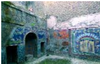
Casa di Nettuno e Anfritrite

Il 24 agosto del 79 d.C. il Vesuvio si risvegliò dopo un lunghissimo sonno, cogliendo di sorpresa le popolazioni dell'area. L'eruzione fu apocalittica: la vita ai piedi del vulcano fu cancellata. Delle città scomparse si perse perfino la memoria. Dopo 1700 anni, le cittadine vesuviane tornarono alla luce, offrendo all'umanità i due più importanti siti archeologici del mondo: Ercolano e Pompei. A differenza di Pompei, sepolta da uno strato di cenere e lapilli, Ercolano fu sommersa da una colata di fango e lava spessa fino a 25 metri. Proprio il fango ha preservato i materiali, sigillando tutto: il legno, le stoffe e i cibi hanno subito una lenta trasformazione, rimanendo però inalterati dentro il loro involucro, quasi pietrificati. Nel 1709 il principe d'Elboeuf, facendo scavare un pozzo in una delle sue ville, s'imbattè per caso nelle strutture del Teatro. Re Carlo di Borbone ordinò nel 1738 l'inizio ufficiale degli scavi. La sorpresa più clamorosa fu la maestosa Villa dei Papiri , dalla quale fu estratto il patrimonio di sculture in bronzo e in marmo (oggi al Museo Archeologico Nazionale di Napoli) e la biblioteca di papiri (più di 1800 testi di argomento filosofico, ora alla Biblioteca Nazionale di Napoli). Nel 1927 iniziò lo scavo delle abitazioni e degli edifici pubblici: a nord si raggiunse il Foro, centro della vita economica, sociale e politica, a est la Palestra, a sud le Terme suburbane.