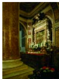
Santuario di Maria Santissima dell'Arco

accumulata nel corso dei secoli, tappezza le pareti.